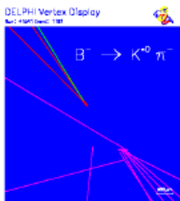
Seltener Zerfall eines B-Mesons: Deutlich ist der Abstand zwischen den Zerfallsprodukten des Mesons und dem primären Wechselwirkungspunkt zu erkennen.

Die Kurven sind die Vorhersage der Theorie für 2, 3 oder 4 Teilchengenerationen.